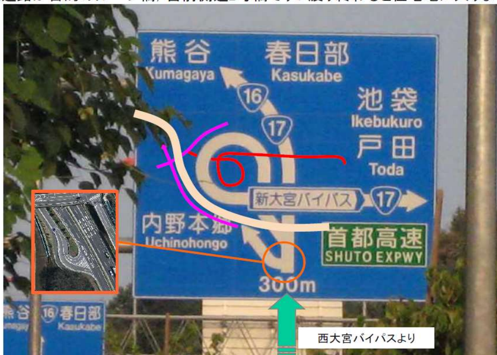
写真: 宮前インター西交差点のファミリーマート前から撮影

赤く示した道路が目的のループ橋、宮前側道2号橋です。渡り終わると住宅地に入ります。